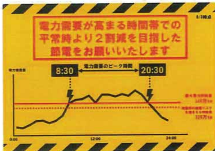
首相官邸Twitterより引用